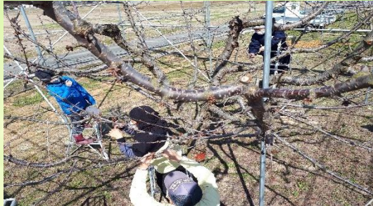
(左写真芽かき作業)

A 型事業所の農業部門では、3 月に入り、サクランボの剪定した枝集めや、芽かき作業のお手伝いの依頼があり、地域の方と連携し外部活動を行っています。依頼者の方からは「作業も早く丁寧に行ってくれるのでとても助かります。」と、さらにお仕事の依頼もありました。農業の担い手が少なくなった今、地域の方と連携を図りおいしい農作物を育てる喜びを利用者の方にも味わって頂きながら、地域に貢献し社会参加を提供できるように、今後も取り組んでいきます。