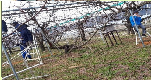
(右写真芽かき作業)

A 型事業所の清掃部門では、高齢者の居住スペースを快適な空間で過ごして頂く為に、清掃の技術を身に付け、日々工夫を行いなから取り組んでいます。コロナ禍で他施設へ就業する為、健康管理にも十分に気を付け、手洗い・うがい・マスクの着用を徹底し取り組んでいます。