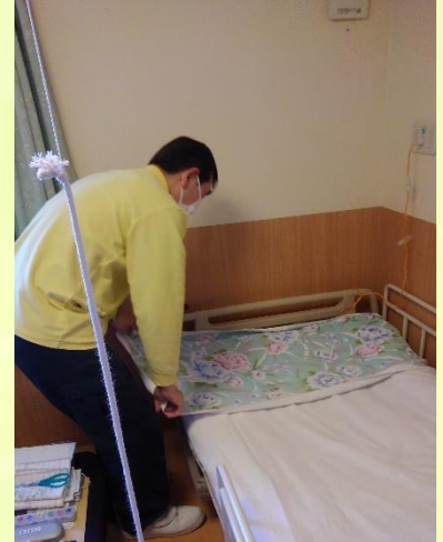
(右写真居室寝具セット)