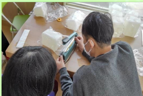
(上写真シーラー作業)