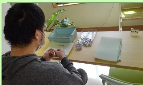
(右・下写真ネジ締め作業)