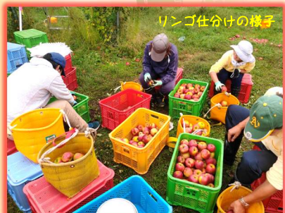
リンゴ仕分けの様子

写真は銀杏の収穫の様子です。長い棒の先に熊手のようなフックを取り付け木の枝の根元の方から先端に向け滑らせるように操作、実っている銀杏を熊手に引っ掛けて落とす仕組みとなっています。木の周りの地面にはネットを掛けて設置、ネット上に落とされた銀杏を回収します。銀杏はもう少し時を経てさらに黄色が明るく色づき少し実の表面が柔らかくなるころには枝を軽くゆすただけで落ちてきますしその時期が過ぎたころには自然に落下します。しかしそこまで待つと食する「仁」の部分は黄色味を帯びてしまいます。最も食に適して見栄えの良い鮮やかなエメラルドグリーン色の付加価値の高い「仁」を収穫するためには頑丈に枝についている実を写真のような方法を用いての作業が必要となります。