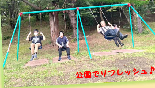
公園でリフレッシュ♪

作業所の方では、内職作業でいつも座りっぱなしのため、運動不足になりがちです。そのため、仕事量の少ない日はみんなでウォーキングに出掛けます。 今回は秋晴れの寒河江八幡宮に参拝し、近くの公園でリフレッシュしてきました。また明日からの仕事を頑張れそうです。