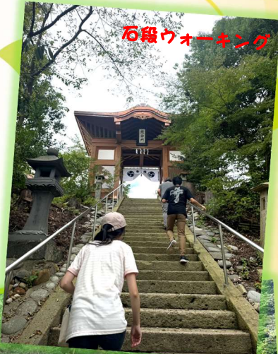
石段ウォーキング