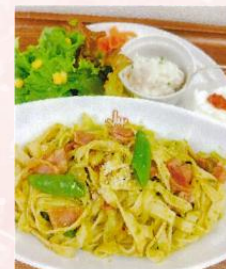
ジェノバゼバスタプレート ¥1,000 (税別)