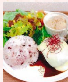
韓流ハンバーグプレート ¥1,000 (税別)