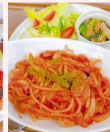
ナポリタンプレート ¥880 (税別)