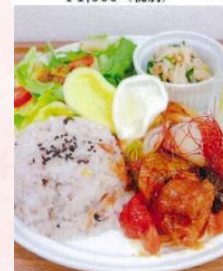
梅ジャム豚豚プレート ¥1,000 (税別)